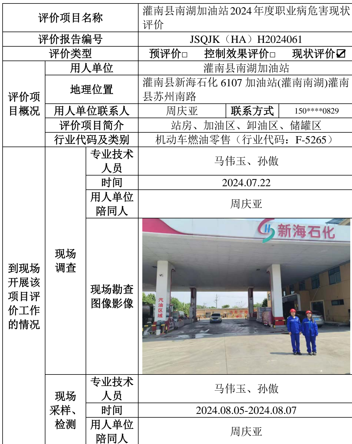
职业卫生评价报告网上公开信息表